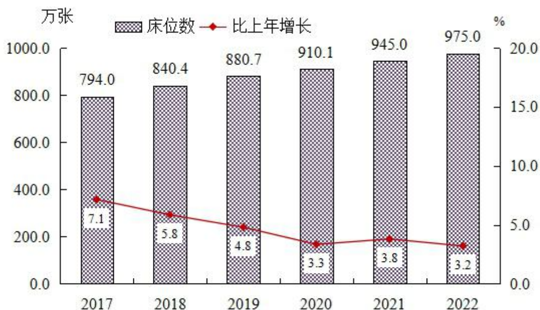
图2 全国医疗卫生机构床位数及增长速度

每千人口医疗卫生机构床位数由 2021 年 6.70 张增加到 2022 年 6.92 张。