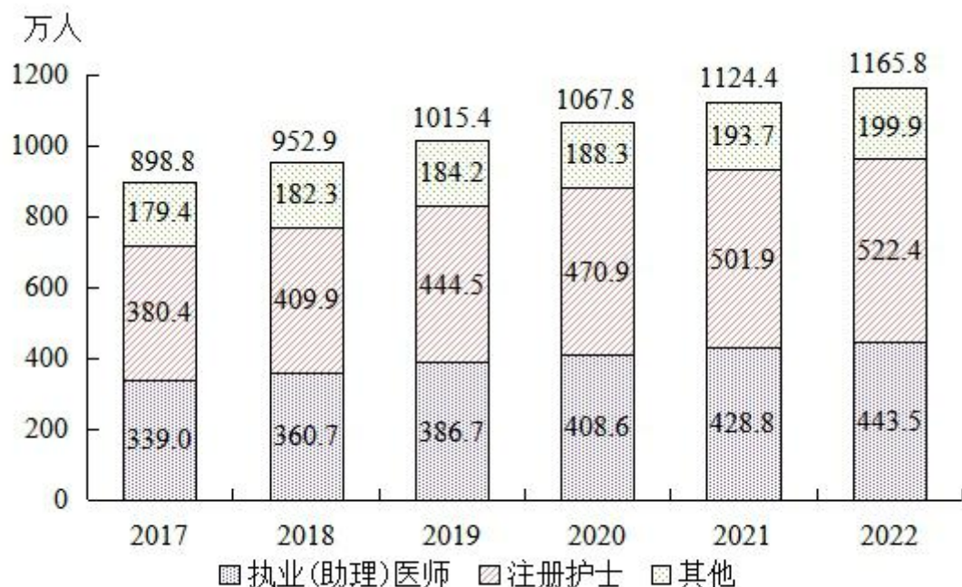
图3 全国卫生技术人员数

2022年，每千人口执业（助理）医师3.15人，每千人口注册护士3.71人；每万人口全科医生数为3.28人，每万人口专业公共卫生机构人员6.94人（见表3）。