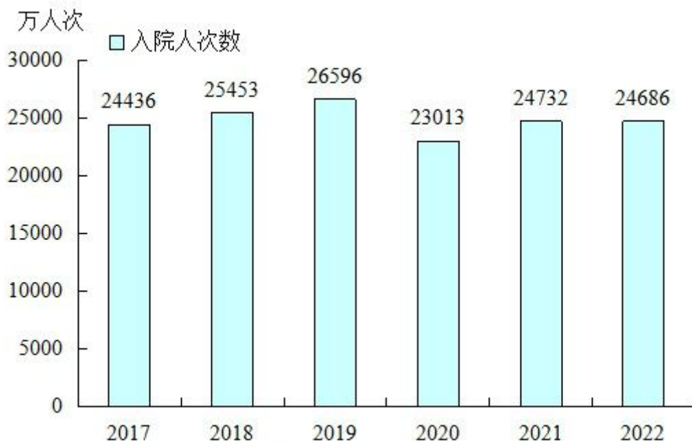
图5 全国医疗卫生机构住院量

(二) 医院医师工作情况。2022年，医院医师日均担负诊疗6.2人次、住院2.1床日，其中：公立医院医师日均担负诊疗6.6人次、住院2.0床日（见表6）。