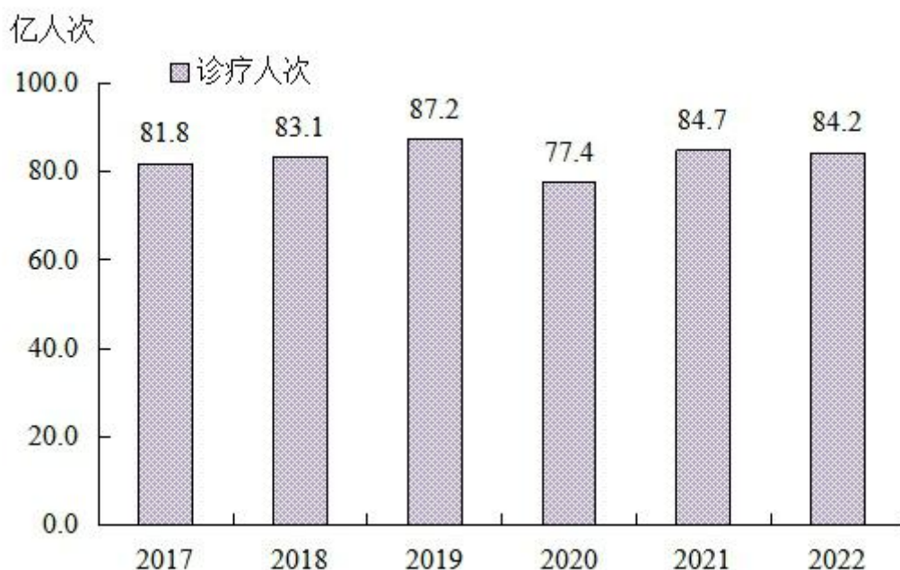
图4 全国医疗卫生机构诊疗量

2022年，公立医院诊疗人次31.9亿（占医院总诊疗人次的83.4%），民营医院诊疗人次6.3亿（占医院总诊疗人次的16.6%）（见表5）。